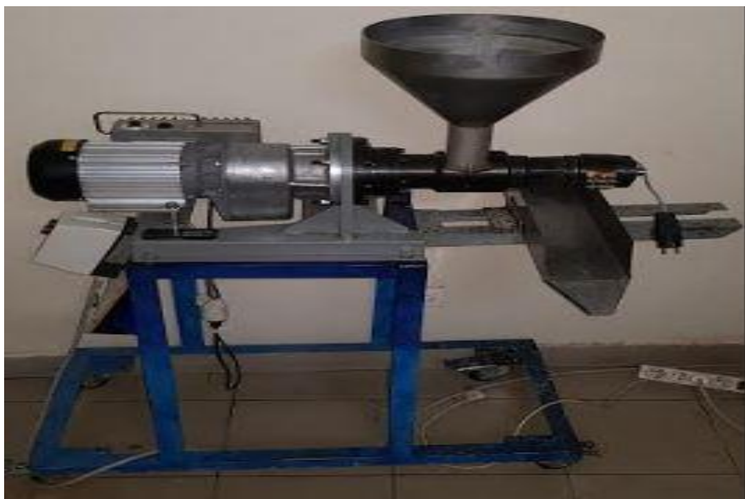
Figure 2-1 : Presse KK10 Huile Prince F Universel sur support

L'huile est évacuée par les trous perforés du cylindre de presse. La compression se produit lorsque les matières premières s'écoulent avec la vis d'Archimède et sont pressées par obstruction dans la tête de la presse et évacuées par le petit trou de la buse au diamètre spécifié. Les résidus se présentent sous forme de gâteau ou de pellet, connu sous le nom de gâteau de presse ou gâteau de semence.